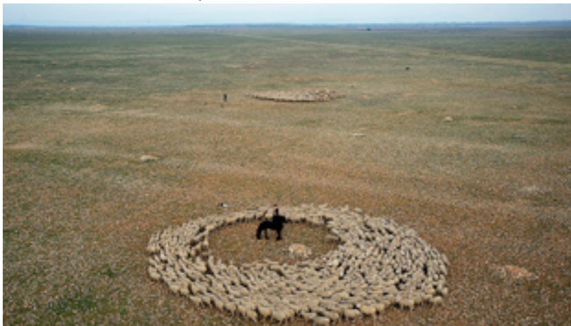
Prairies nomades / Animaglyphe

Justine Oulie – Sur notre territoire très rural, il n'y a pas de musées, pas d'espaces dédiés à l'art contemporain, pas de vraies propositions artistiques. En conséquence, les personnes n'ont pas l'habitude d'aller voir ce genre de pratiques. Les personnes ne se sentent pas légitimes, elle se disent que ce type d'art n'est pas fait pour elles. Et en même temps, proposer des œuvres dans la nature, hors des musées et des lieux culturels habituels, permet de toucher des personnes qui n'auraient pas passé le seuil d'un centre d'art. Cela a pris du temps pour créer une adhésion générale sur Horizons Sancy . Lorsque nous installons une œuvre au sein d'un village, nous faisons presque du porte-à-porte pour expliquer, donner envie d'aller voir. Il y a forcément de la pédagogie car l'objet artistique va apporter un flux de personnes inhabituel.