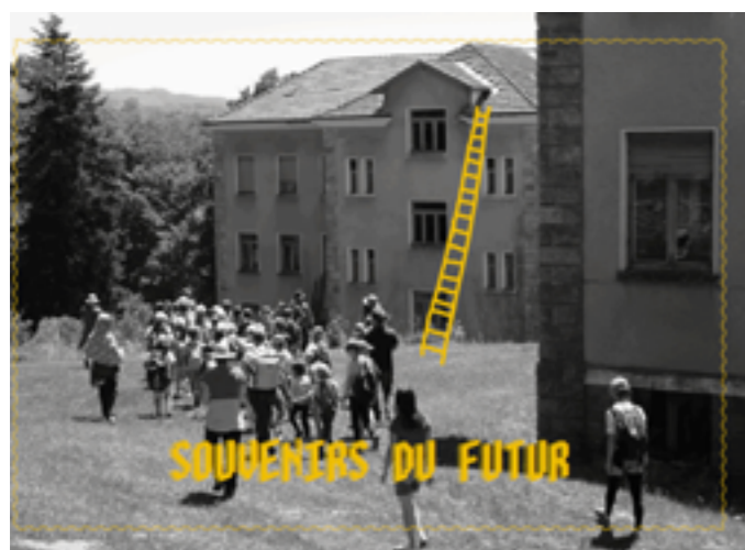
La Grande Échelle

Ce travail a été accompagné par des étudiants et étudiantes du cycle Design des mondes montagneux qui se sont penchés sur le sujet de l'accueil des réfugiés climatiques. Cela a fait réagir les élus, les personnes qui vivent ici... Mais comment on se projette aussi sur ces lieux comme des ressources foncières pour des personnes qui en auront vraiment besoin dans les prochaines années ? La question du tourisme s'inscrit aussi dans cette réflexion selon moi. Il faut se demander comment l'accueil concerne tout le monde, toutes les populations. Il faut aussi prendre conscience que ces lieux sont souvent très délaissés, on ne sait pas comment ouvrir la porte,