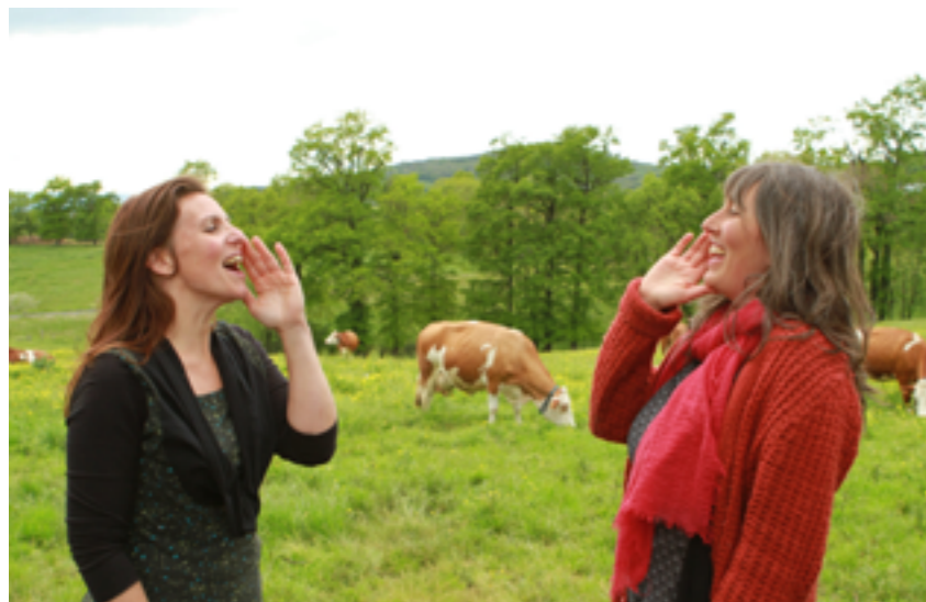
Prairies nomades

Fanny Herbert – Nous sommes convaincus de la nécessité de faire bouger les lignes des appels à projets descendants pour se donner les moyens d'agir. Par exemple, nous accompagnons un projet d'EAC à Ambert Cherchons la nuit . Finalement, notre approche et les sujets dépassent largement ce cadre car nous parlons d'éclairage public, des travaux de nuit, des activités nocturnes, des lieux ouverts tard, des patrouilles de police. Et tous ces sujets croisent des enjeux d'urbanisme, de patrimoine, de tourisme. Le sujet est bien plus vaste que