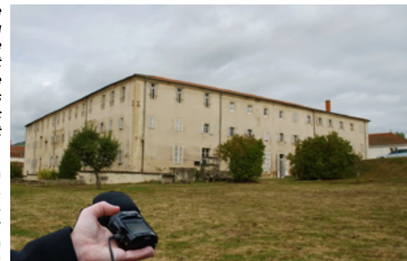
La Grande Échelle