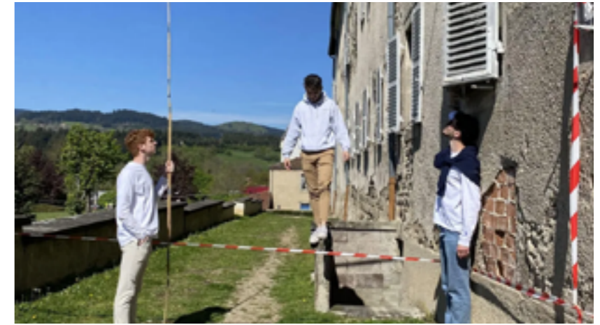
La Grande Échelle