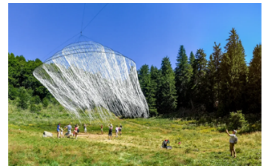
Horizons Sancy

besoin de se rencontrer, reconnaître les enjeux de chacun, comprendre les pratiques de chaque monde. J'aimerais beaucoup, pour aller plus loin sur l'événement, proposer des temps de spectacle vivant comme des concerts, des pièces de théâtre. Cela permet aussi de toucher de nouvelles personnes, y occuper l'espace différemment. Être en pleine nature et avoir accès à un spectacle casse les codes et facilite l'accès à la culture. Pas besoin de faire « x » km en voiture, de s'habiller convenablement, de s'organiser. D'ailleurs, sur le sujet de l'accessibilité, nous avons aussi des progrès à faire car les sentiers d'accès aux œuvres ne sont pas du tout pensés pour des personnes en fauteuil, en situation de handicap car il s'agit presque de randonnées parfois pour aller les voir. J'aimerais que les personnes en EHPAD puissent bénéficier de cette offre culturelle, les enfants dans les écoles... Nous faisons des enquêtes régulièrement pour sonder la satisfaction des usagers et le sujet de l'accessibilité revient souvent. Il y a très sûrement des choses à développer sur la présence plus importante des artistes sur place, des formats numériques.