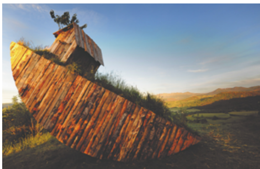
Horizons